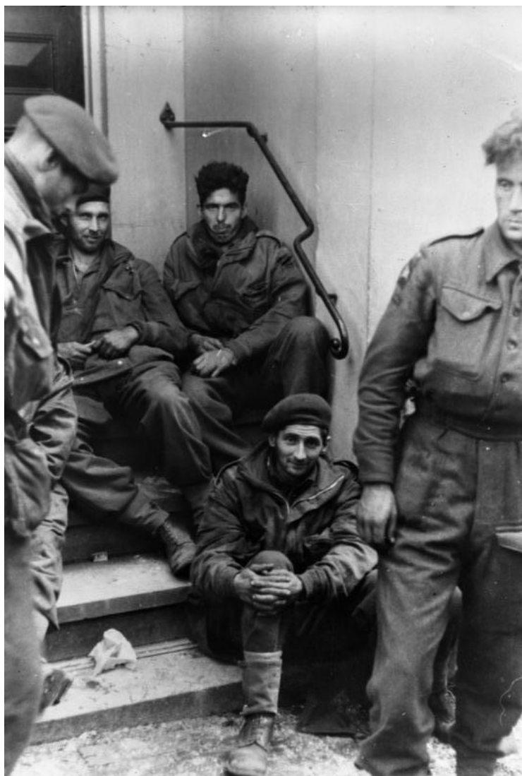
Bundesarchiv, Bild 183-J2705 Foto: 6. Aug. - 1. September 1944

Foto van Britse krijgsgevangenen in Arnhem in september 1944. De Duitse troepen vechten hier tegen de Engelse parachutisten in het kader van operatie Market Garden. (Bundesarchiv, CC BY-SA)